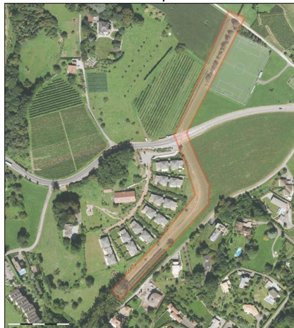
Situation de l'emprise de l'ECF

Au vu de ce qui précède, afin de pallier les insuffisances de capacité et de biodiversité de ce tronçon de cours d'eau et de satisfaire aux conditions du PPA précité, le Département du territoire et de l'environnement a décidé, en 2005, de réaliser ce projet dans les meilleurs délais, selon les nouvelles dispositions de l'article 19 de la loi sur la police des eaux dépendant du domaine public (LPDP) et de constituer, à cet effet, une entreprise de correction fluviale (ECF), de compétence du Chef du Département. Les Communes de la Tour-de-Peilz et de Montreux y sont intéressées, selon l'article 40 LPDP.