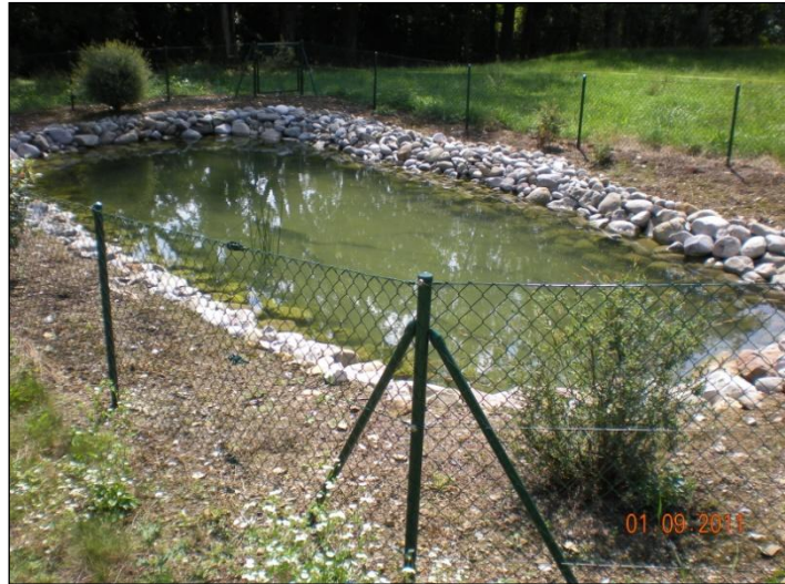
Bassin de rétention

En date du 7 avril 2006, le Chef du Département du territoire et de l'environnement approuvait la constitution de l'Entreprise de construction fluviale (ECF) de la Maladaire pour le tronçon à ciel ouvert, conformément aux dispositions de l'article 24 de la loi sur la police des eaux dépendant du domaine public (LPDP), et fixait les différentes répartitions entre l'Etat de Vaud et les Communes de Montreux et La Tour-de-Peilz. De même, il autorisait l'ECF à procéder aux expropriations des terrains et droits nécessaires à l'exécution du projet.