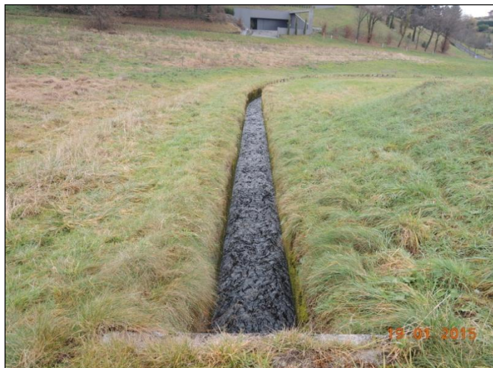
Cunette en aval

La partie en cunette est un tronçon « corrigé » dont la responsabilité de l'entretien et de la surveillance incombe à l'Etat de Vaud. Sa capacité est insuffisante suite aux augmentations des rejets dus à l'urbanisation. Elle a été équipée de planches de coffrage pour limiter ses débordements, solution provisoire qui dure depuis plus de 15 ans et qui mérite une intervention définitive.