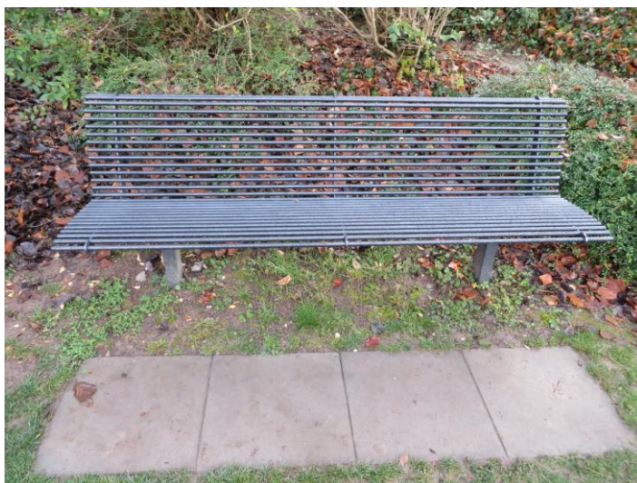
Banc type "AZ"