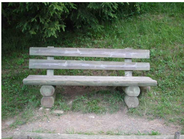
Banc type "Bois Ril"