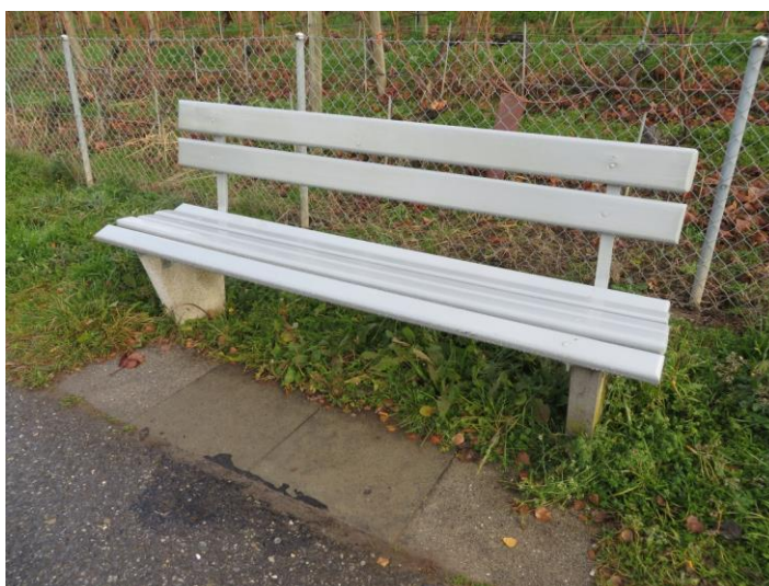
Banc type "Montreux"