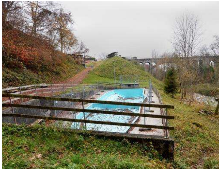
Piscine de Brent

Face aux projections financières des travaux à entreprendre et comme elle l'a communiqué tant au Conseil communal qu'à la Société Villageoise de Brent et Environs (SVBE), la Municipalité a jugé disproportionné de mettre en conformité la piscine de Brent. Ce bassin n'a donc pas été exploité lors de l'été 2019 par contre le site a été sécurisé pour éviter les accidents.