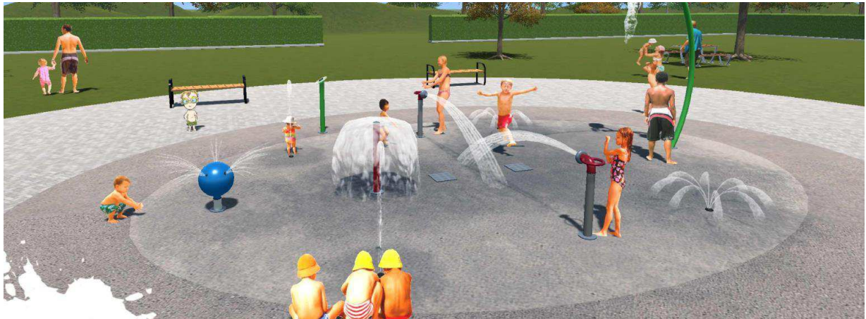
Exemples de jeux d'eau

Un espace sera dédié aux jeux d'eau avec 2 zones distinctes pour les petits et les grands. L'eau ne stagnera pas en surface ce qui permettra d'éviter de devoir surveiller cette zone et d'ajouter du personnel supplémentaire. Ainsi, la surveillance sera assurée par une seule personne, pour le bassin en contrebas.